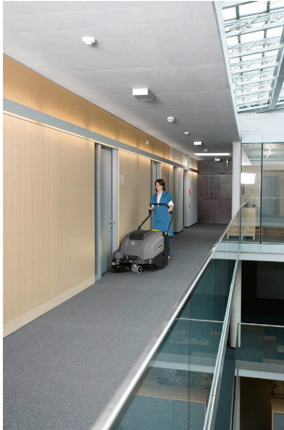
KM 75/40 W Bp Pack